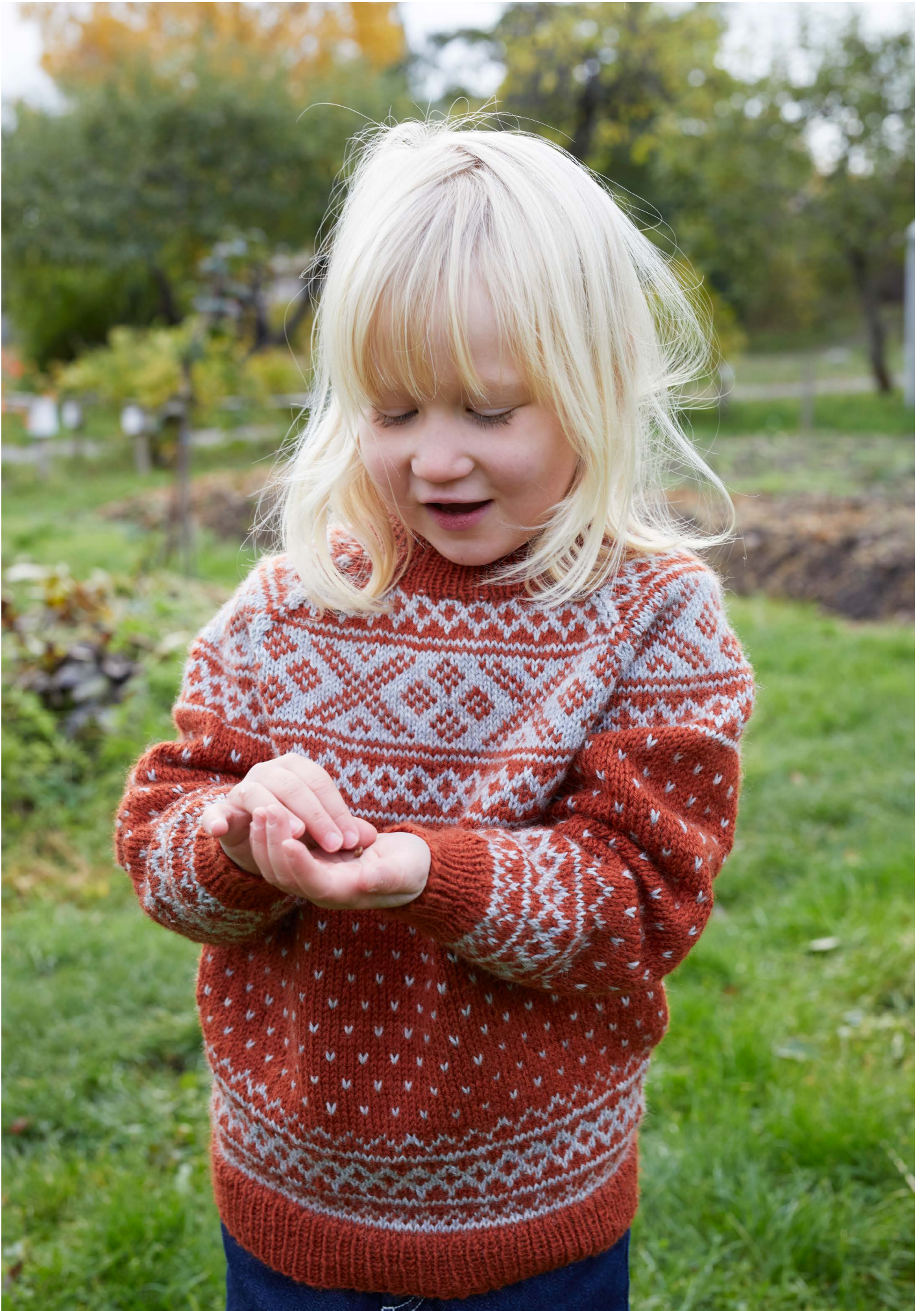
365-4 Setesdalgenser til barn