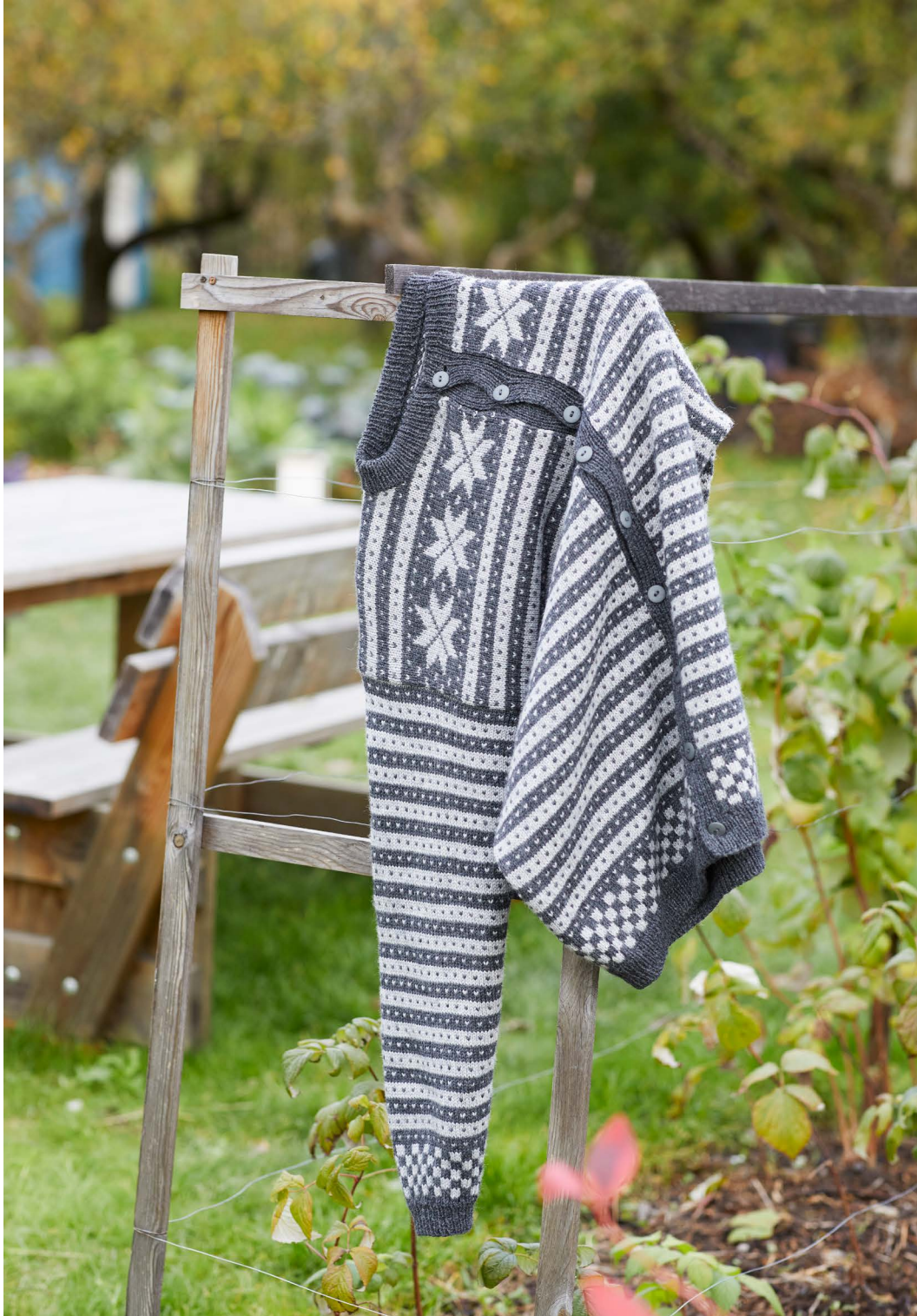
365-12 Fanakofte til herre