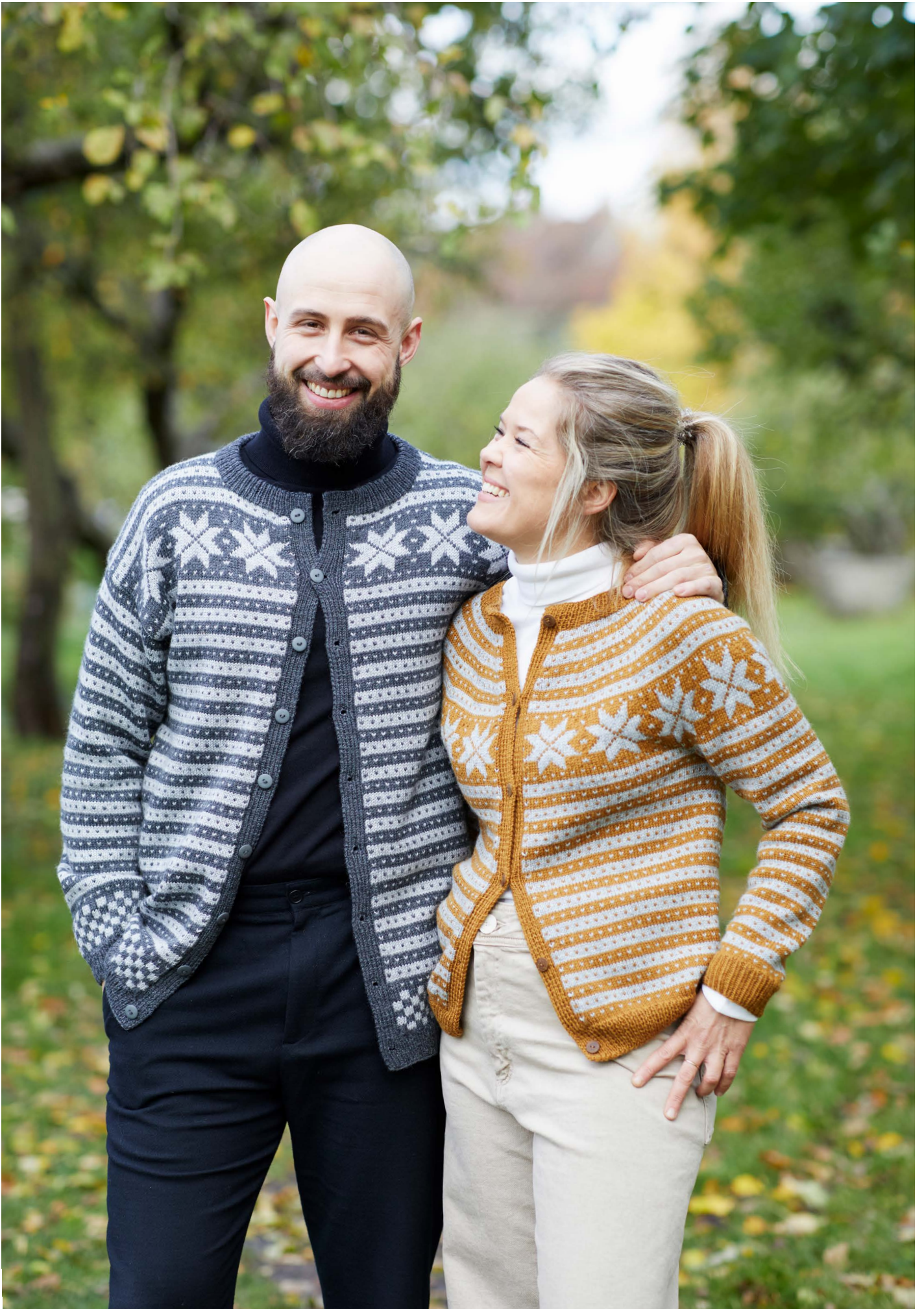
365-12 Fanakofte til herre 365-11 Fanakofte til dame