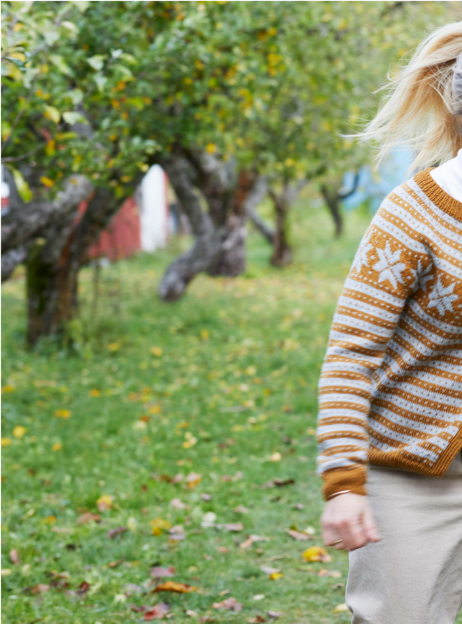
365-11 Fanakofte til dame