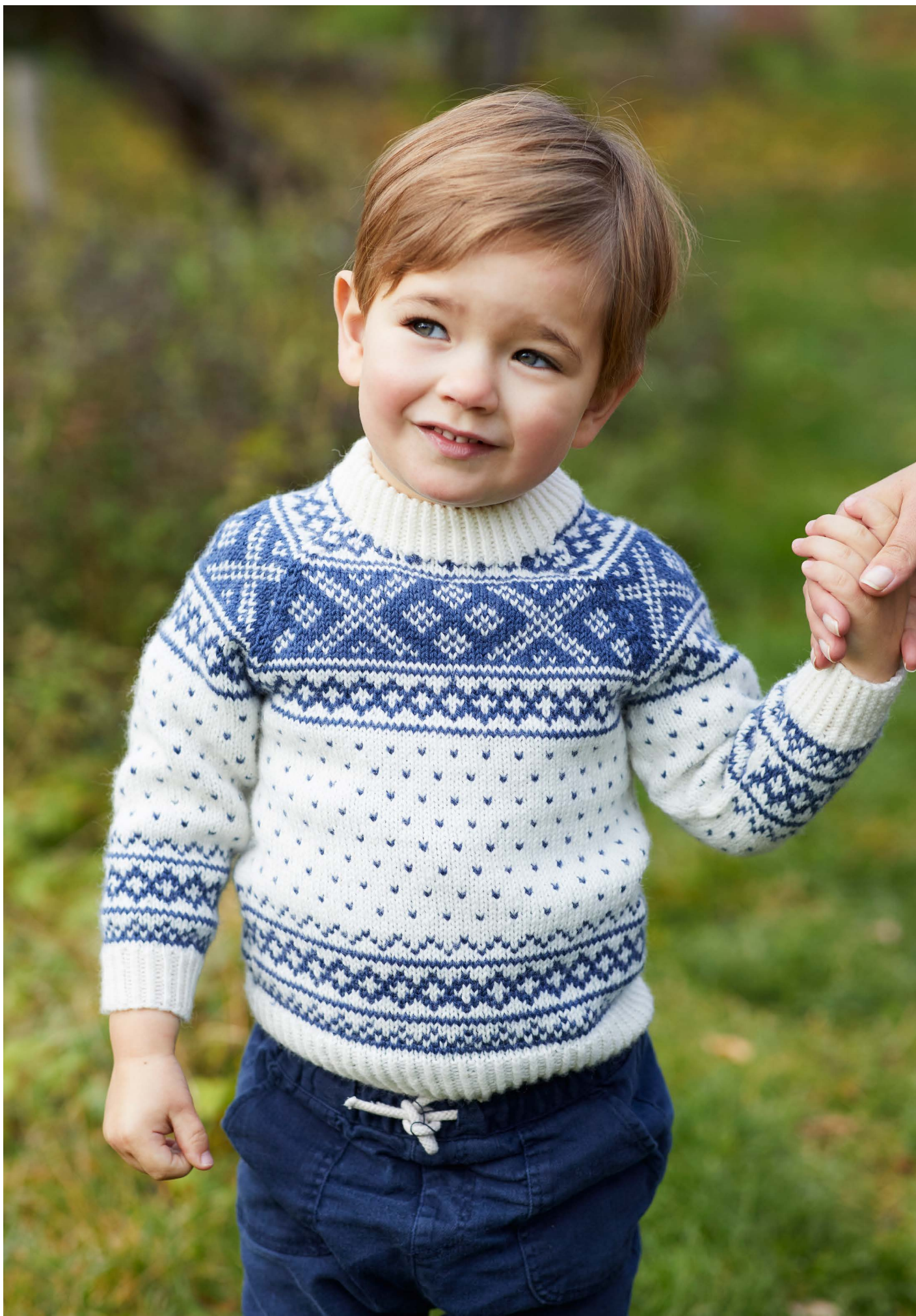
365-4 Setesdalgenser til barn