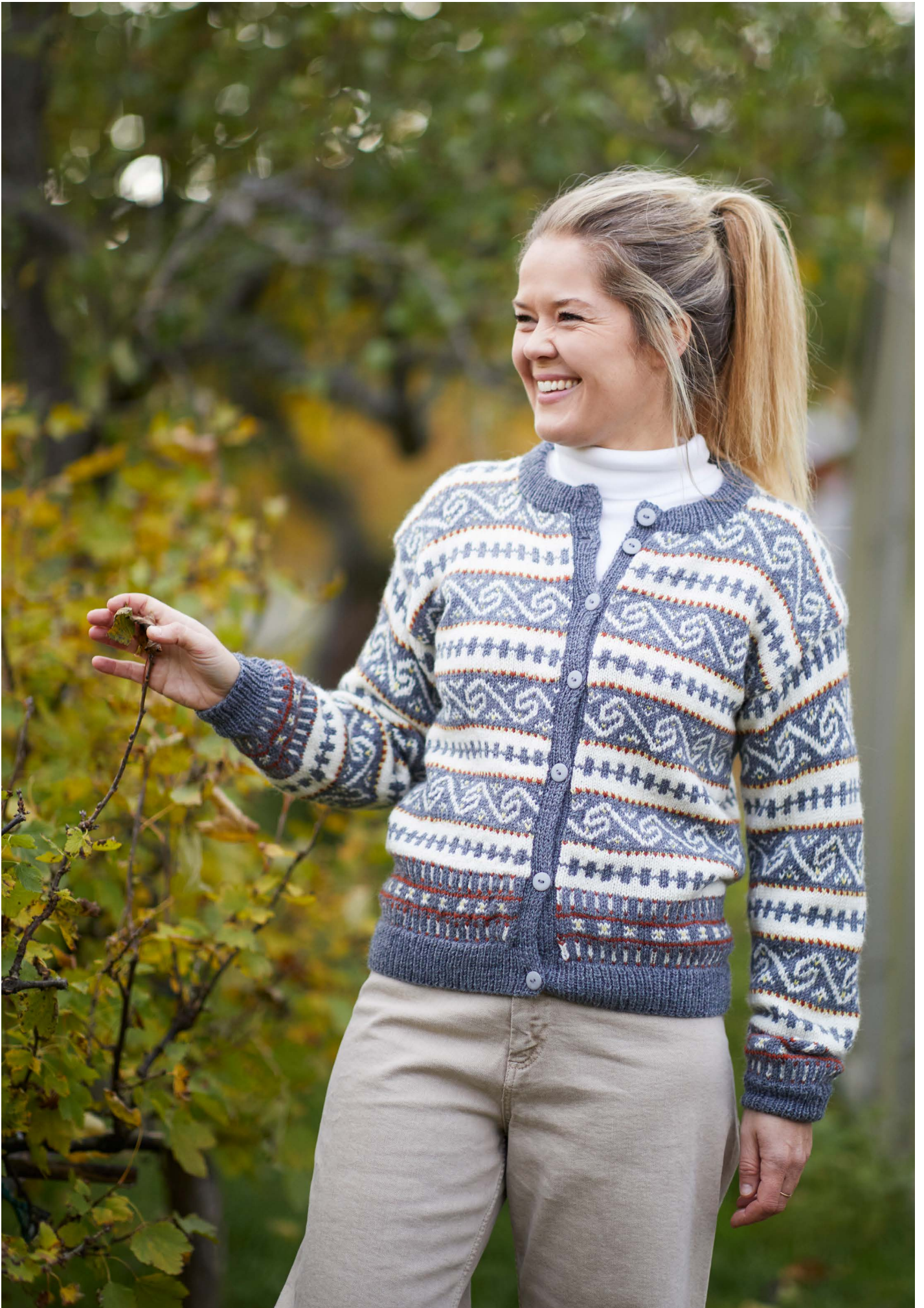
365-14 Nordlandskofte til dame