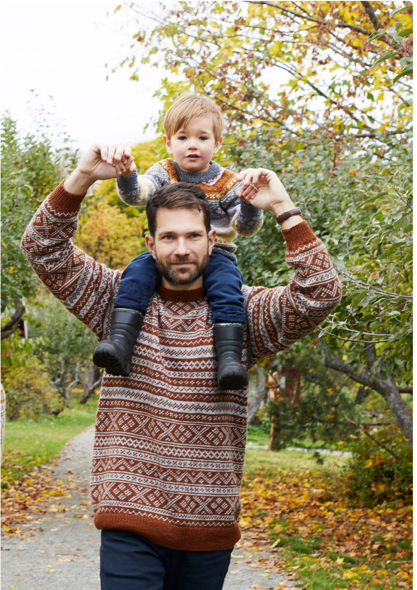
365-7 Genser med norske småborder til barn 365-9 Genser med norske småborder til herre