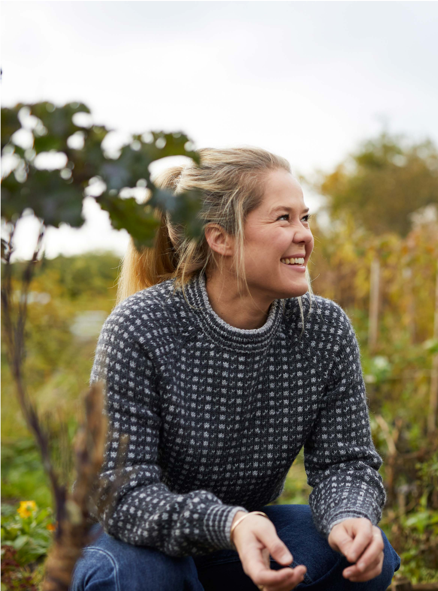
365-2 Islander til dame