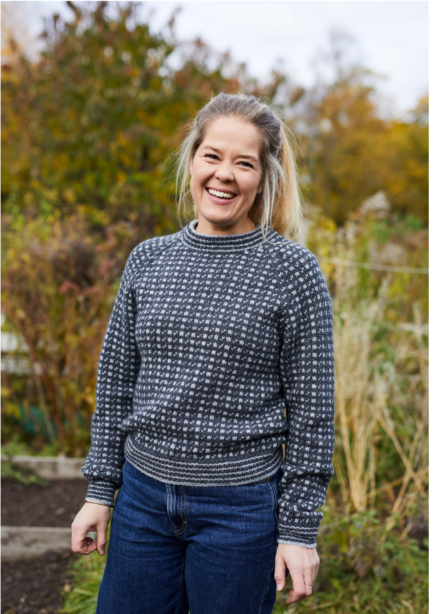
365-2 Islander til dame