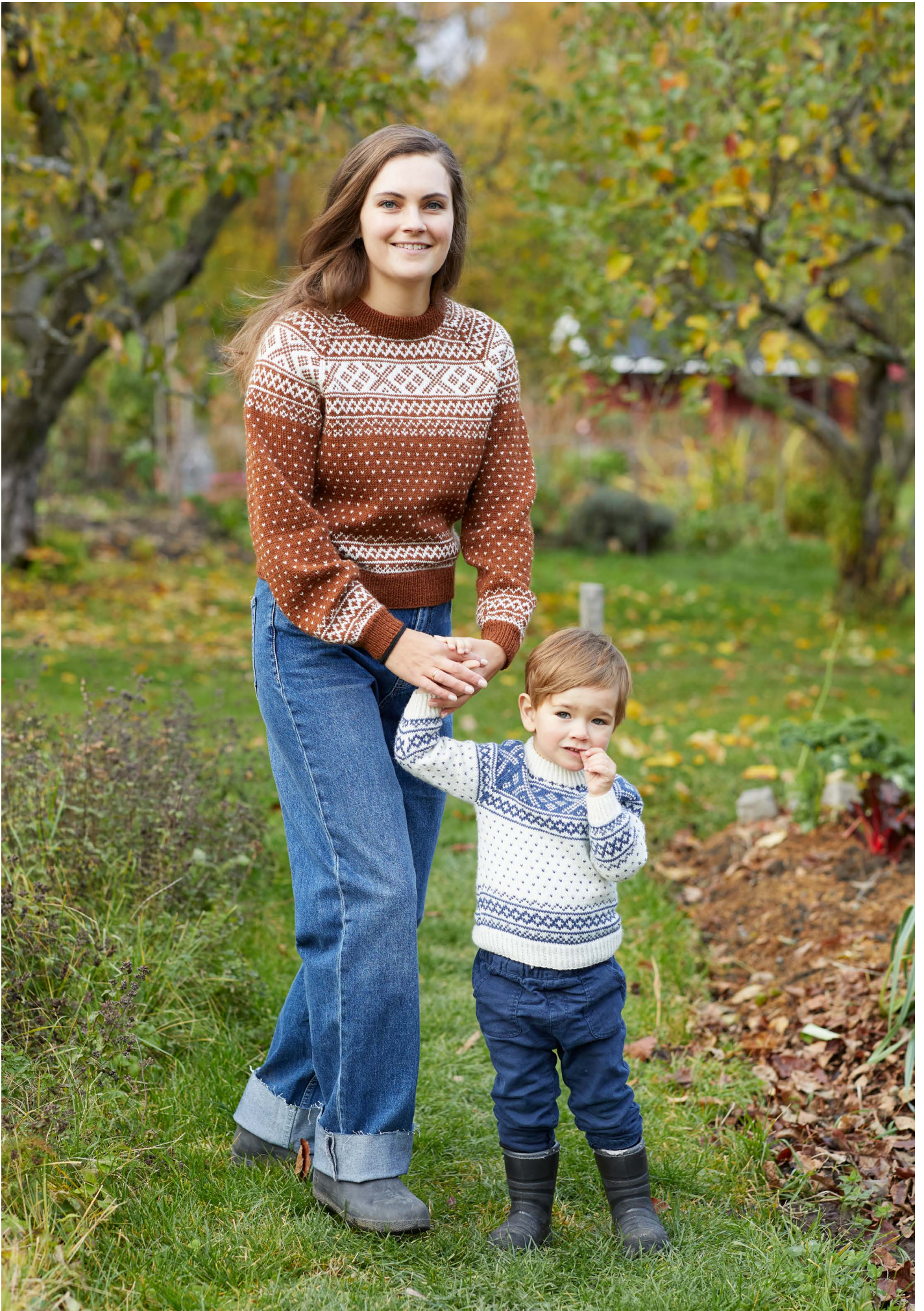
365-4 Setesdalgenser til barn 365-5 Setesdalgenser til dame