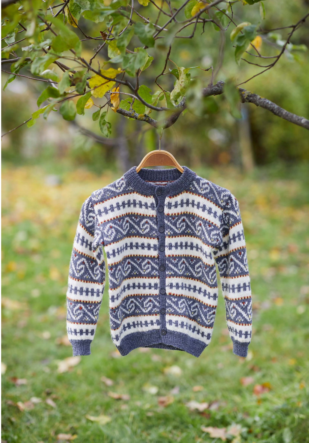
365-13 Nordlandskofte til barn