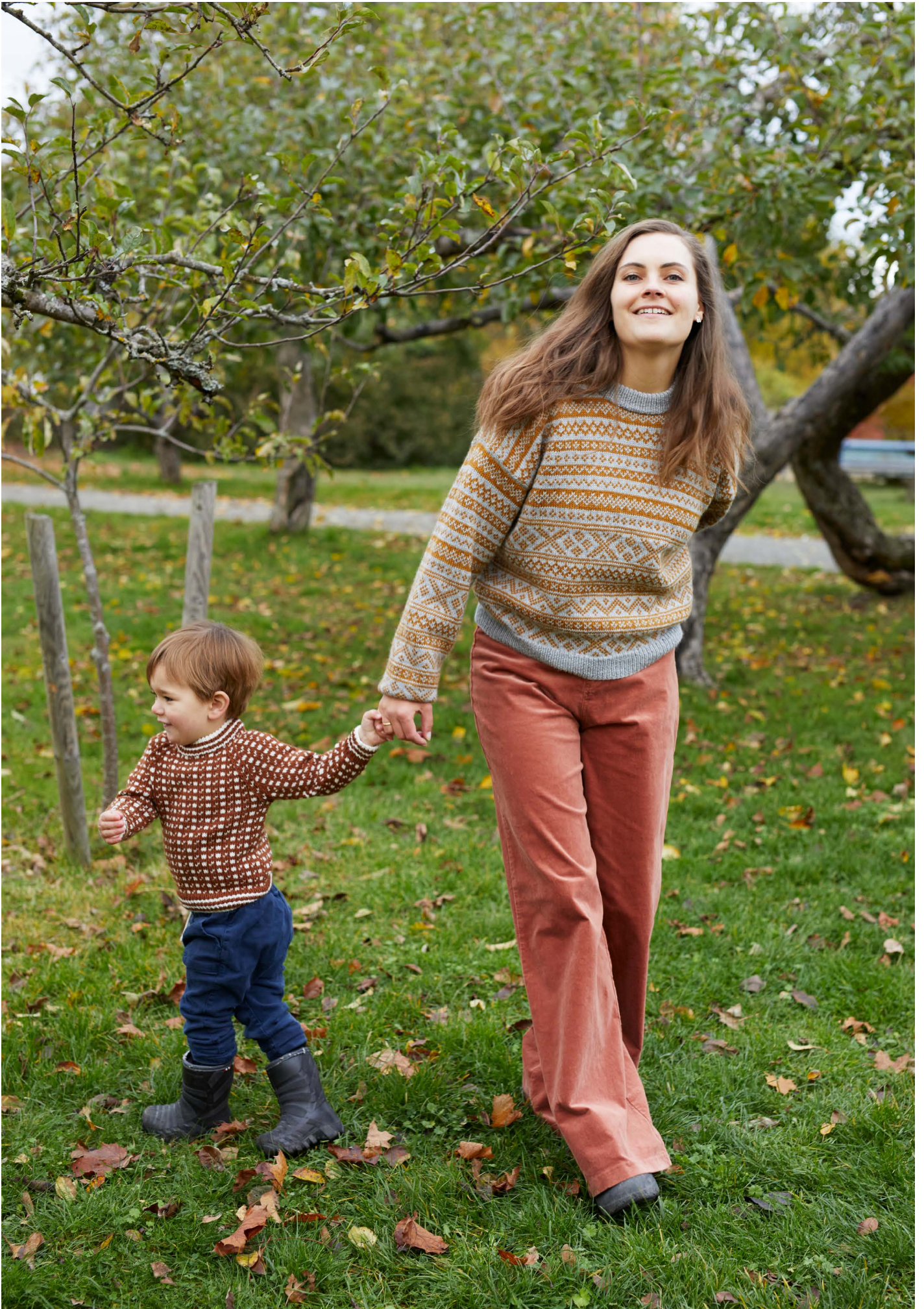
365-1 Islender til barn 365-8 Genser med norske småborder til dame