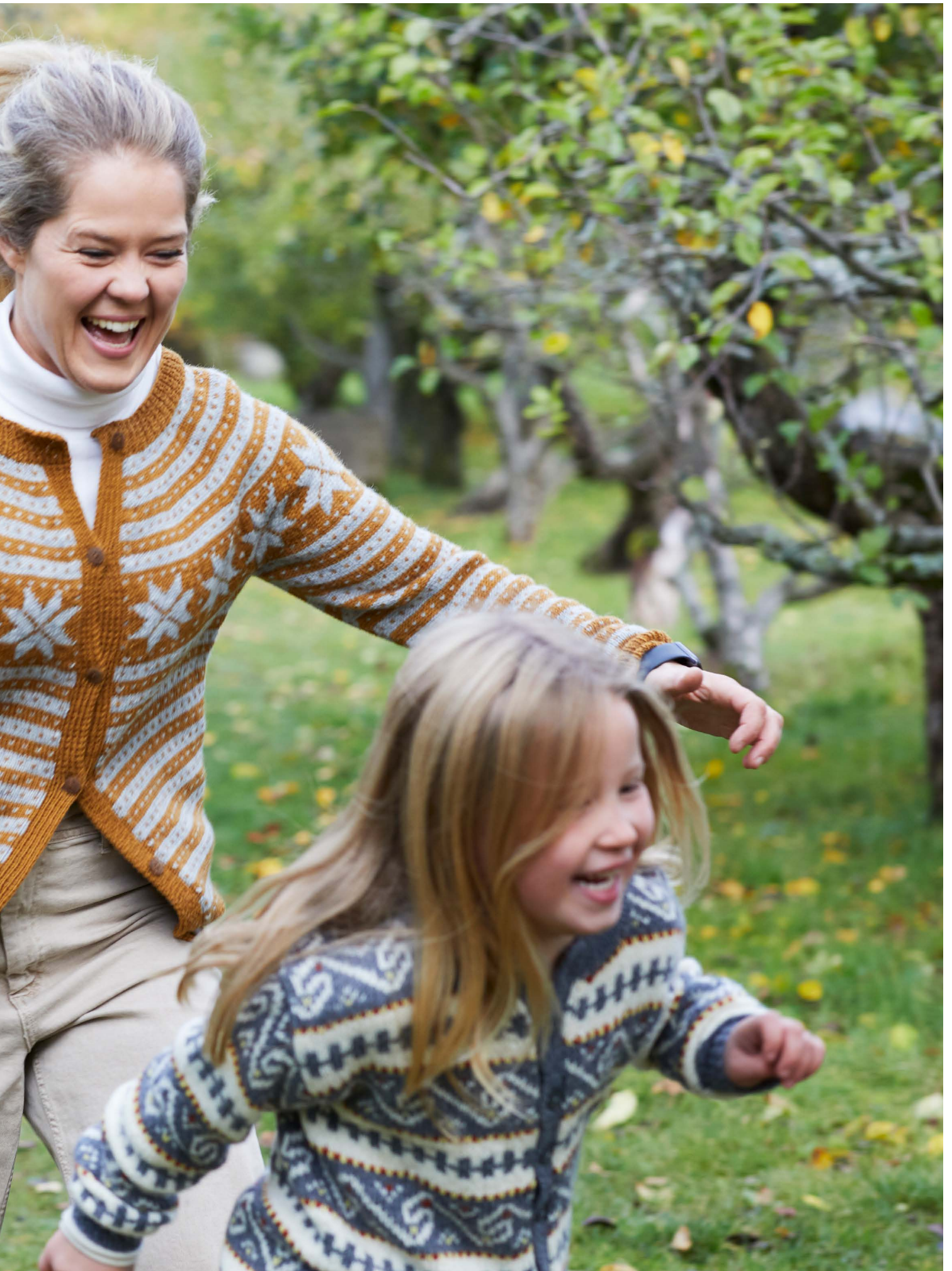
365-13 Nordlandskofte til barn