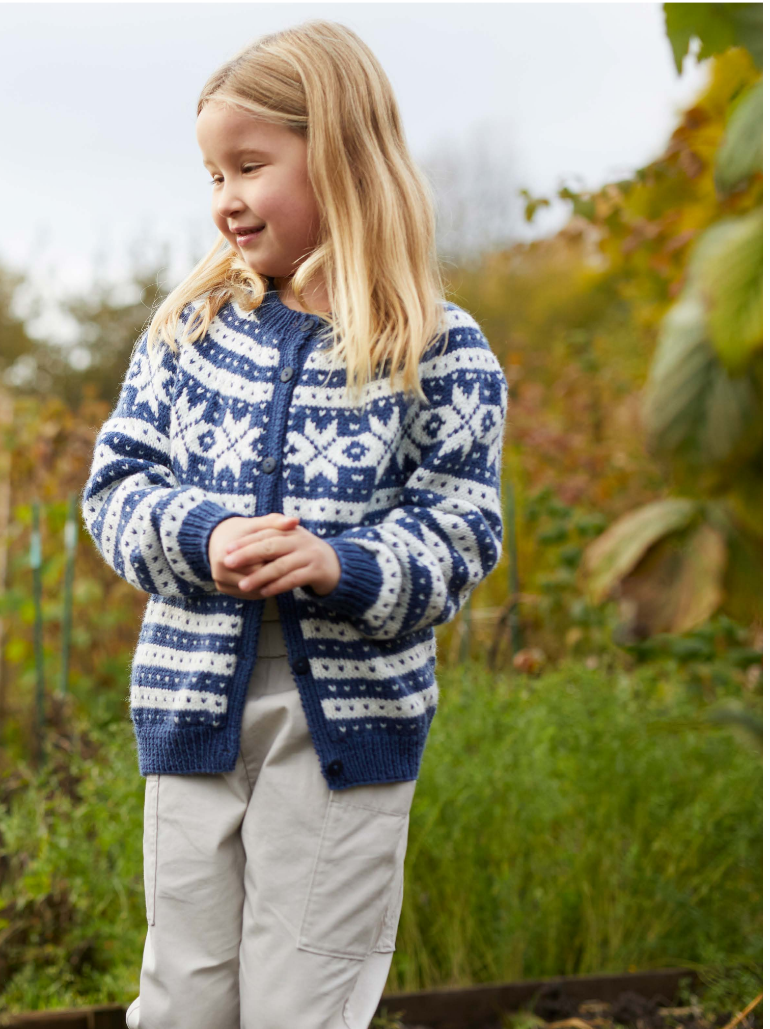
365-10 Fanakofte til barn