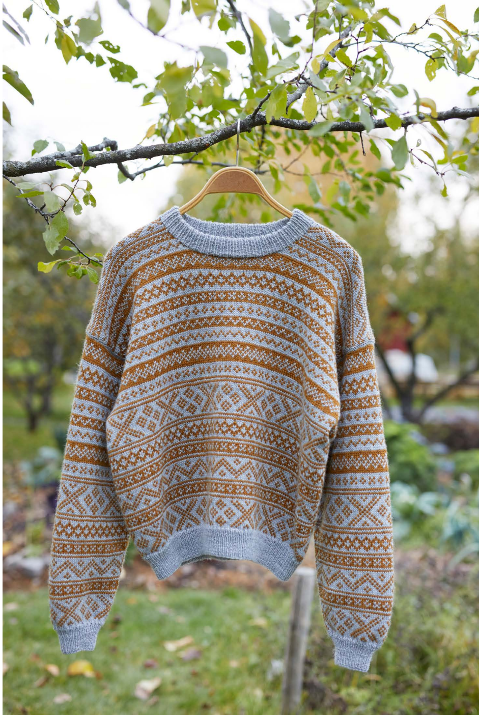
365-8 Genser med norske småborder til dame